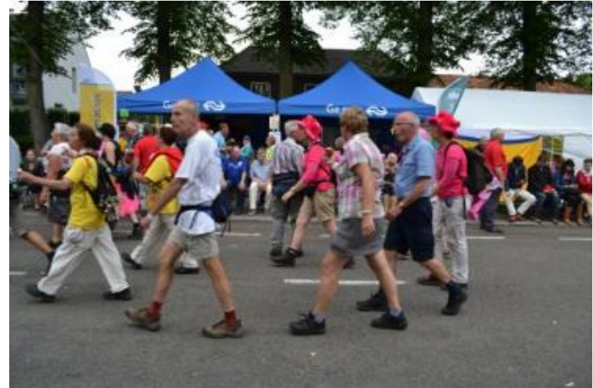
Imago: NS in beeld en klaar voor ZORG & SERVICE!

Wij staan voor het 4daagse motto: Eén voor allen, allen voor één!