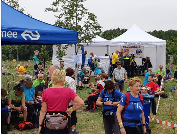
SSOVN/NS post druk bezocht, ook voor een verse versnapering